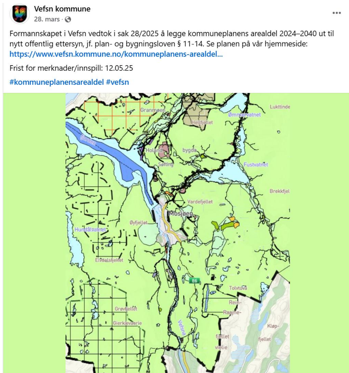
Figur 2. Publisering av offentlig ettersyn av KPA på Facebook