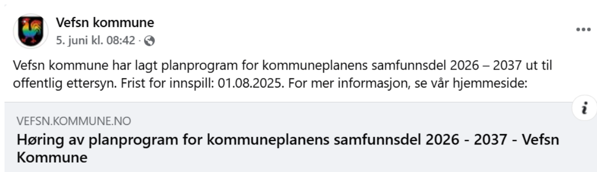
Figur 3. Publisering av offentlig ettersyn av planprogram for samfunnsdelen på Facebook