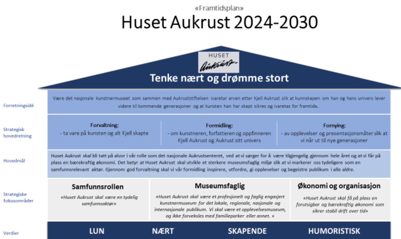
Figur 5. Modell for framtidsplan. Huset Aukrust 2024 – 2030

Strategien «Framtidsplan for kunstmuseet Huset Aukrust – det nasjonale Aukrustsenteret» har en tidshorisont fra 2024 – 2030. Dokumentet som vi har fått tilsendt har et vedlegg som illustrerer en framtidsmodell: