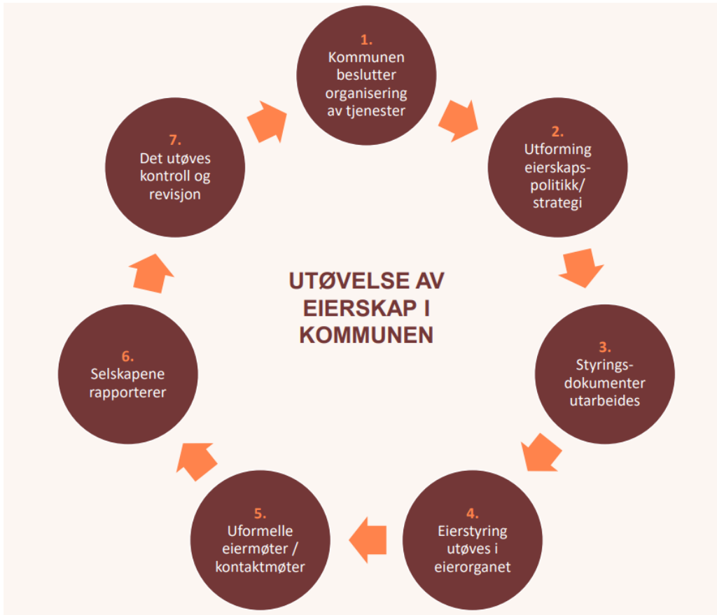
Figur 1. Prinsippskisse for eierstyring