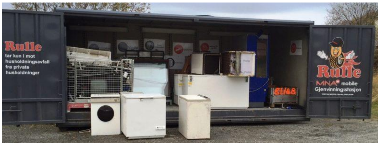
Figur 2. Bilde av Rulle, den mobile gjenvinningsstasjonen